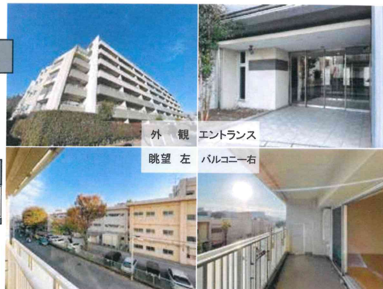
外観 エントランス 眺望 左 バルコニー右